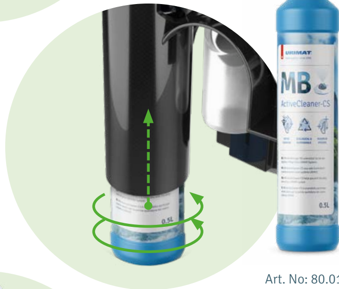
Art. No: 80.016

Eine kurze Drehung mit der Hand und die MB-AktivReiniger-RS Flasche sitzt fest in der Halterung.