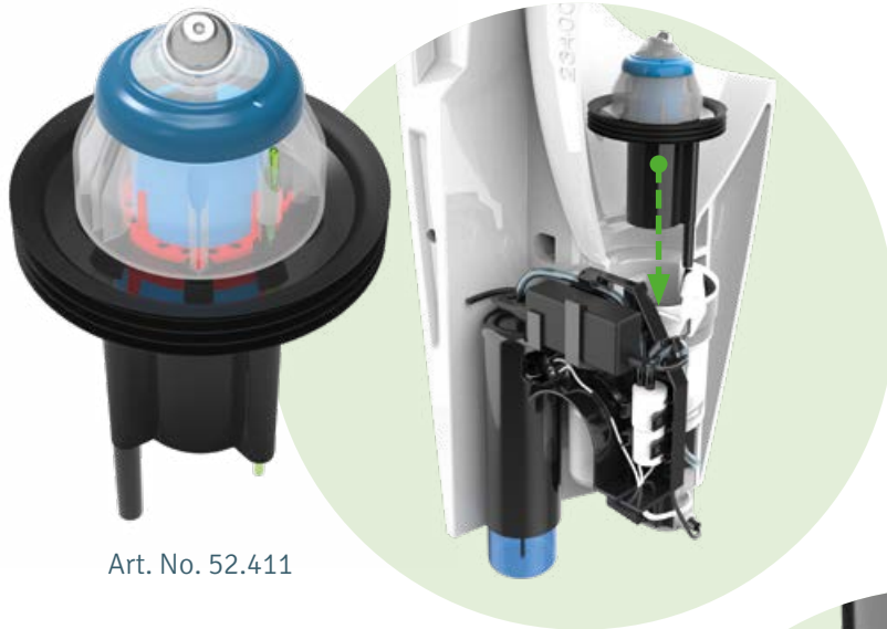
Art. No. 52.411